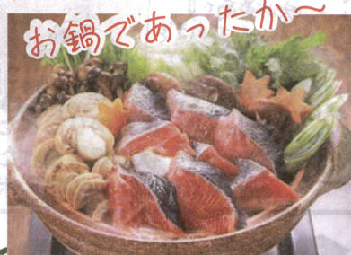
お鍋であっただか〜

切り落としの為、端っこが多く入っていたり、大きさにばらつきがあります。カットしてあるので調理は簡単です♪