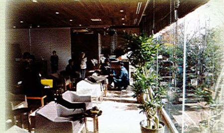
巣鴨信用金庫で5店舗目となるデザイン店舗